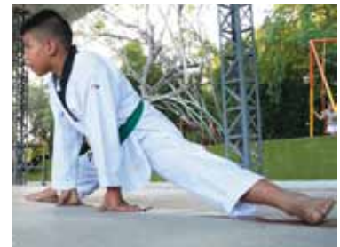
Escuela de Taekwondo

Las ofertas fueron pensadas para los afiliados de las Categorías A y B, por quienes trabajamos para darles una mejor calidad de vida.