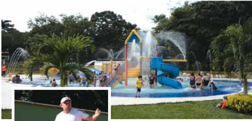
Centro Recreacional Urbano de Picalaña.