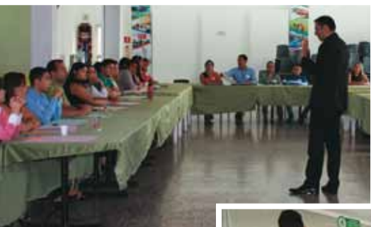
Capacitaciones, seminarios y diplomados.