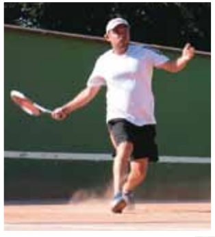
Escuela de Tenis