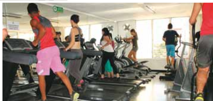
Gimnasio de la 37.

mes de agosto y por el resto del año traerá programas de Diplomado, como Gerencia de Proyectos, al igual que una serie de Conferencias para que los trabajadores puedan mejorar su competitividad, ser mejores líderes en sus áreas. Por supuesto, todos los programas de capacitación están