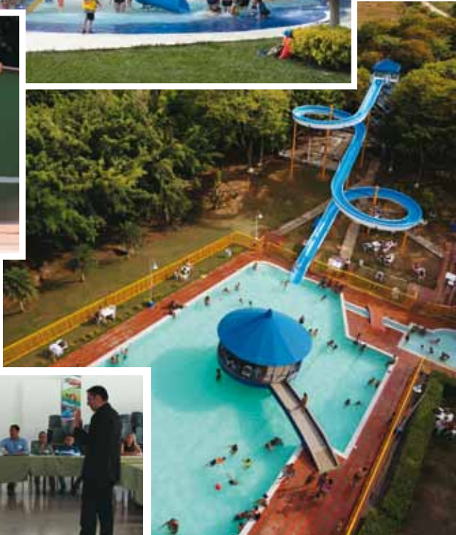
Centro Recreacional Gran Chaparral.