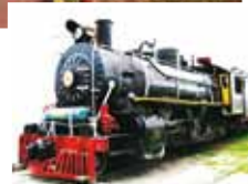
Planes turísticos a Cartagena, Ecuador y Tren de la Sabana