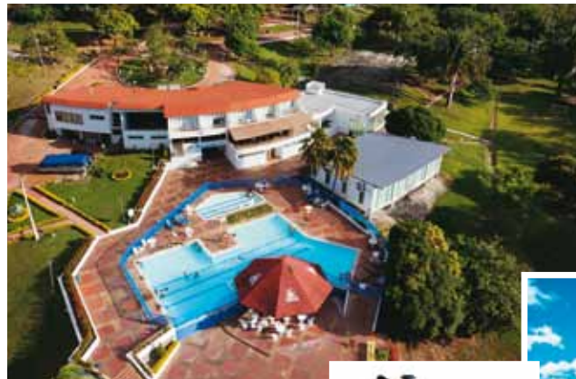
Centro Vacacional Tomogó, Prado