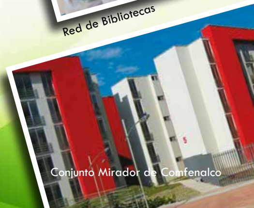
Conjunto Mirador de Comfenalco