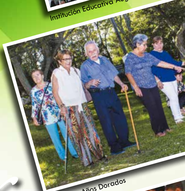
Programa Años Dorados