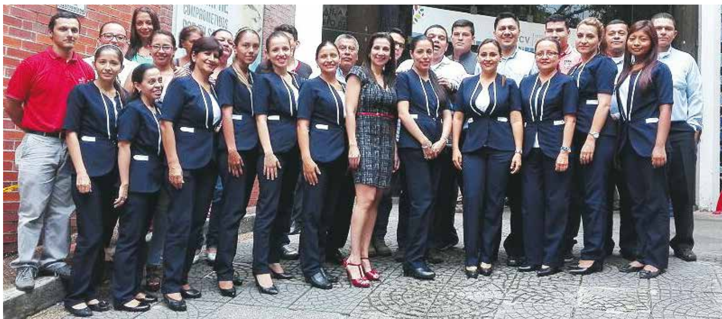
El equipo administrativo de la Clínica Avidanti Ibagué, antes Diacorsas.

Ibagué es una ciudad privilegiada al tener una oferta amplia de clínicas especializadas en atención integral para pacientes con enfermedades complejas.