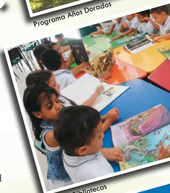
Red de Bibliotecas