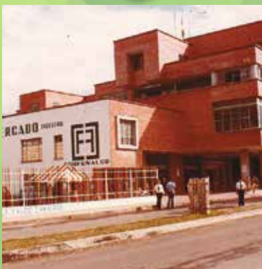
Construcción del edificio sede de la calle 37 con carrera 5 esquina.