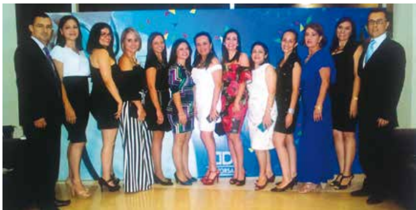
En la foto, el grupo directivo de Avidanti Ibagué.