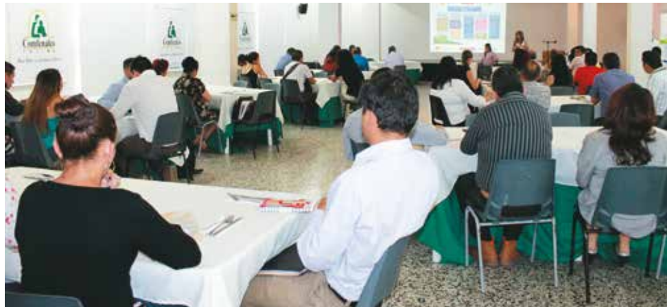
Comfenalco Tolima dio inicio al programa en el mes de mayo, con la socialización ante representantes del sector público.

Comfenalco Tolima inició el programa Estado Joven en mayo del 2017 con la convocatoria a entidades públicas, trabajo que continuó por tres