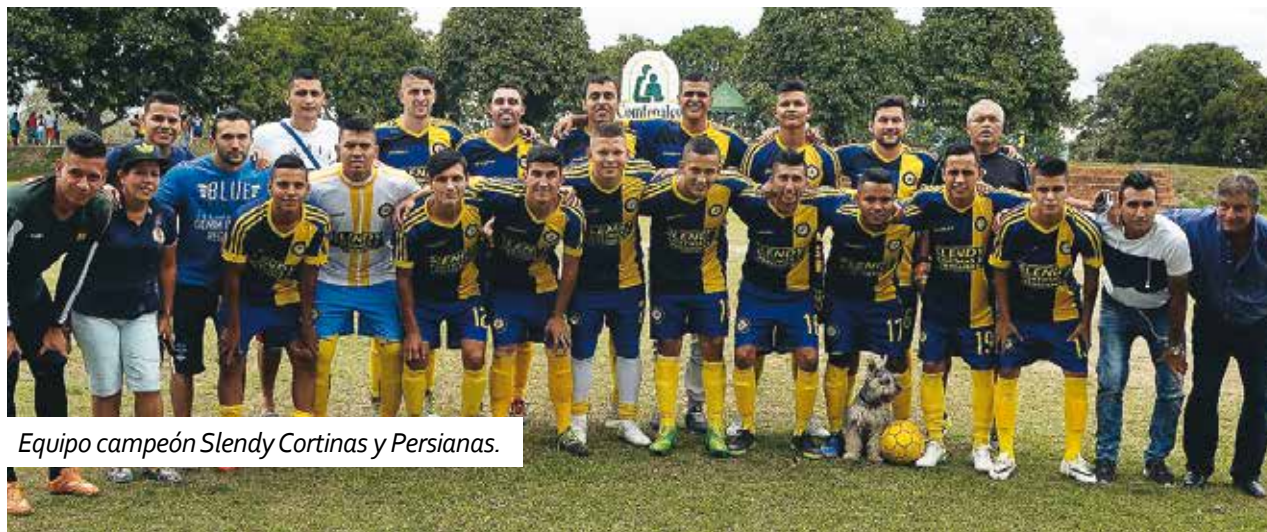
Equipo campeón Slendy Cortinas y Persianas.

En esta edición, Familia & Vida habló con algunos de los participantes quienes contaron su experiencia en la participación del equipo en la Súper Copa de Fútbol Comfenalco Tolima que celebra el deporte y la amistad.