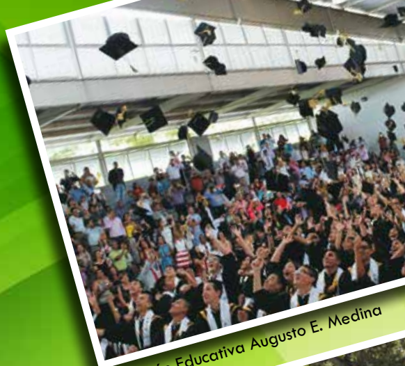
Institución Educativa Augusto E. Medina

Es así, que en el año 2017 la Caja de Compensación de Fenalco del Tolima Comfenalco llega a los 59 años, convirtiéndose en la primera Caja de Compensación del departamento que muestra experiencia y liderazgo en la generación de bienestar para los trabajadores y sus familias. A continuación presentamos 59 motivos para celebrar.